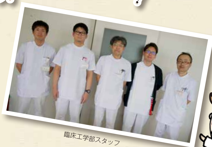
臨床工学部スタッフ

○臨床工学技士は患者さんが安心して医療機器を使用していただけるよう管理・点検を行っています。また、医療機器の管理だけでなく、生命維持監視装置の操作、スタッフへの医療機器の研修、医療ガス配管の点検も行っています。