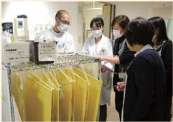
定期的に院内を回り、危険な所がないか、ルールに従った取り扱いをしているかなどをチェックをしています。