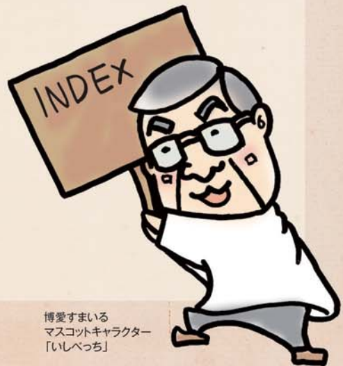
博愛すまいる マスコットキャラクター 「いしべつち」