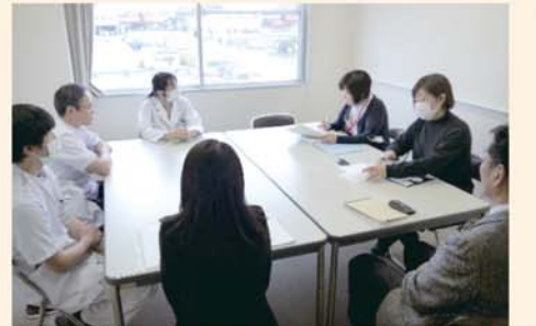
カンファレンス風景