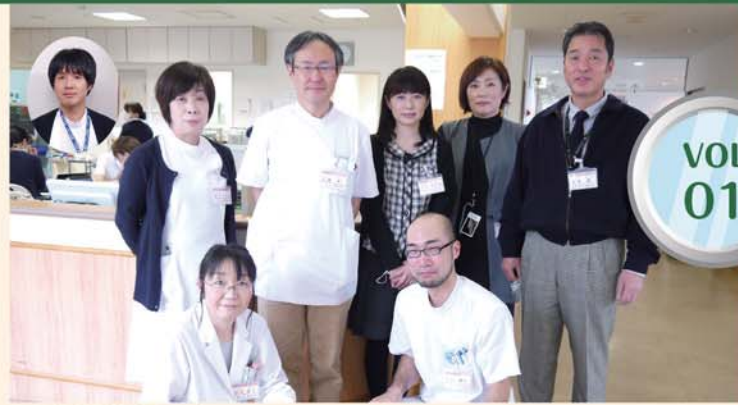
医療安全対策室メンバー