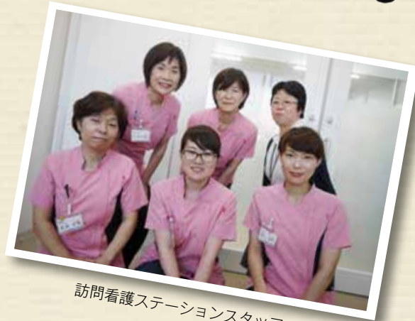
訪問看護ステーションスタッフ