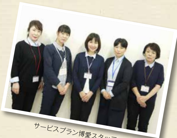
サービスプラン博愛スタッフ