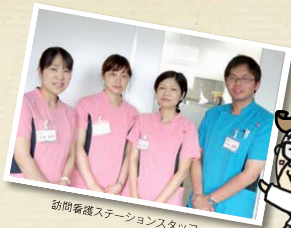
訪問看護ステーションスタッフ