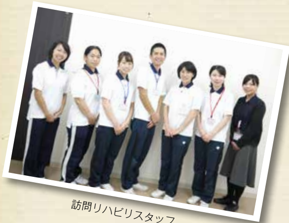
訪問リハビリスタッフ